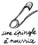
une épingle à nourrice